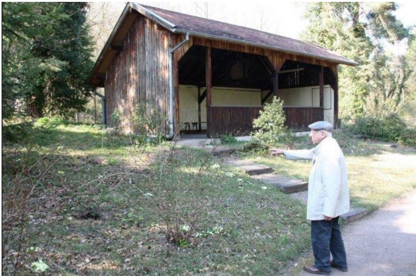
Le local utilis é pour les conf é rences sera bient o t agrandi pour un meilleur confort du public.